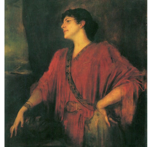
Neue Pinakothek München

ACHTUNG FORTGESCHRITTENE: Es gibt mehr Buchstaben auf der Karte, als für die Lösung benötigt!